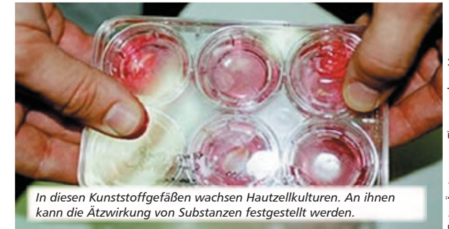
In diesen Kunststoffgefäßen wachsen Hautzellkulturen. An ihnen kann die Ätzwirkung von Substanzen festgestellt werden.

Dagegen werden jährlich Milliarden von Euro in die Tierversuchsmaschinerie gepumpt, statt in den Ausbau von zukunftsweisender Forschung: Verwendung von menschlichen Zellkulturen, Computer-Simulation, In-vitro-Forschung und vieles mehr.