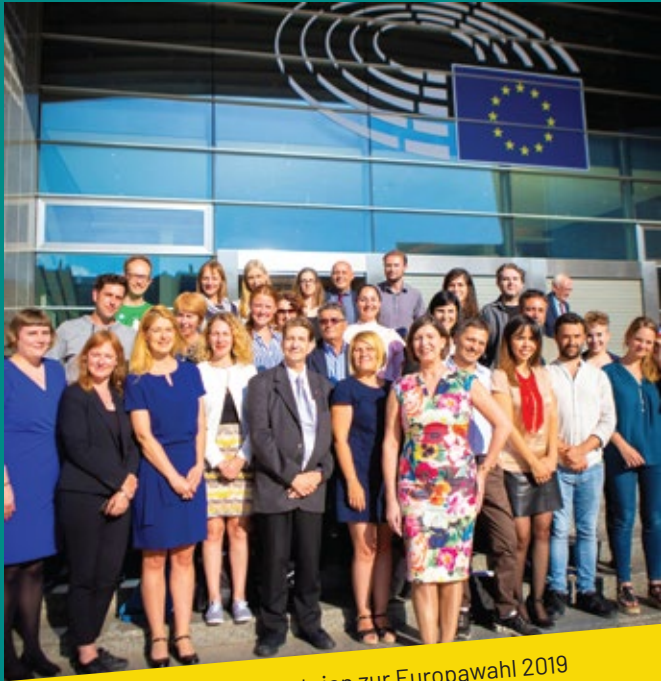
Europäische Tierschutzparteien zur Europawahl 2019